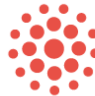
Sciences des données