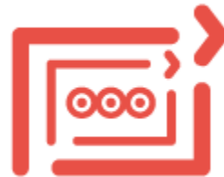
Sciences du logiciel