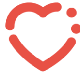
Santé du futur