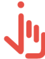
Contenus et interactions